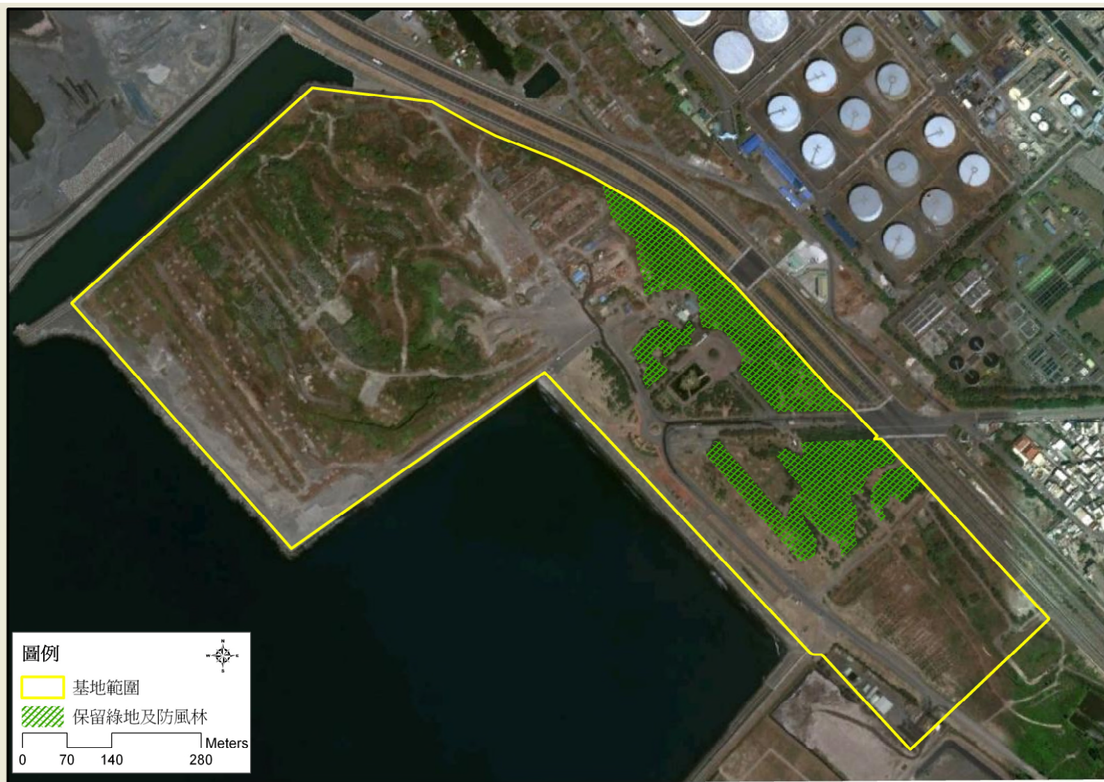
圖 3.1.5-1 本計畫保留之綠地及防風林範圍